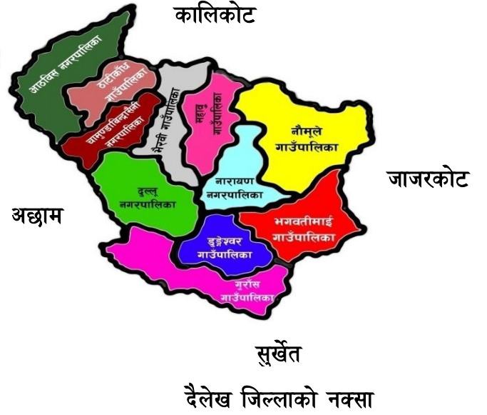
दैलेख जिल्लाको नक्सा

दैलेख जिल्ला कर्णाली प्रदेश अन्तर्गतका १० जिल्ला मध्येको एक पहाडी जिल्ला हो। यस जिल्लाको जिल्ला सदरमुकाम नारायण नगरपालिका दैलेख बजारमा रहेको छ। यस जिल्लाको दक्षिण, उत्तर, पूर्व तथा पश्चिम गरी चारै तर्फ महाभारत श्रृंखलाहरू रहेका छन् भने उक्त श्रृंखलाहरू उत्तरमा पूर्व पश्चिम गरी फैलिएका छन्। यस जिल्लामा ७ वटा गाउँपालिका र ४ नगरपालिका रहेको छन्। यस जिल्लाको १५००५१ हेक्टर अर्थात् १५०२ वर्ग किलोमिटर क्षेत्रफल रहेको यस जिल्लाको सदरमुकाम दैलेख बजार हो।