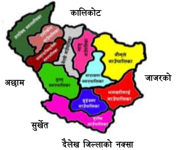
दैलेख जिल्लाको नक्सा

दैलेख जिल्ला कर्णाली प्रदेश अन्तर्गतका १० जिल्ला मध्येको एक पहाडी जिल्ला हो। यस जिल्लाको जिल्ला सदरमुकाम नारायण नगरपालिका दैलेख बजारमा रहेको छ। यस जिल्लाको दक्षिण, उत्तर, पूर्व तथा पश्चिम गरी चारै तर्फ महाभारत श्रृंखलाहरू रहेका छन् भने उक्त श्रृंखलाहरू उत्तरमा पूर्व पश्चिम गरी फैलिएका छन्। यस जिल्लामा ७ वटा गाउँपालिका र ४ नगरपालिका रहेको छन। यस जिल्लाको १५००५१ हेक्टर अर्थात १५०२ वर्ग किलोमिटर क्षेत्रफल रहेको यस जिल्लाको सदरमुकाम दैलेख बजार हो।