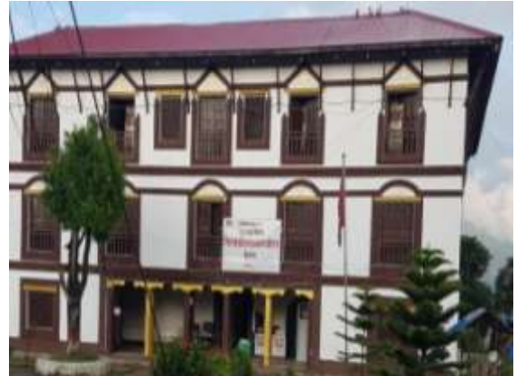
जिल्ला प्रशासन कार्यालय, दैलेखको भवन

नेपालको संविधान, २०१९ बमोजिम नेपाल अधिराज्यलाई १४ अञ्चल ७५ जिल्ला र ५ विकास क्षेत्रमा विभाजन गरियो। स्थानीय प्रशासन विकेन्द्रीत प्रशासन व्यवस्था अनुरूप संचालन गर्न तथा शान्ति सुरक्षा व्यवस्थापनलाई प्रभावकारी रूपमा संचालन गर्न स्थानीय प्रशासन ऐन, २०२८ जारी गरी लागू गरियो। उक्त ऐनको दफा ५ ले जिल्लाको सामान्य प्रशासन संचालन गर्न प्रत्येक जिल्लामा एउटा जिल्ला प्रशासन कार्यालय रहने व्यवस्था