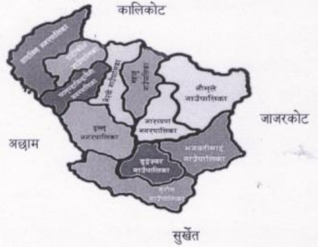
दैलेख जिल्लाको नक्सा