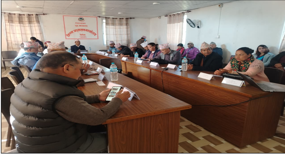
जिल्ला विपद् जोखिम न्यूनीकरण तथा व्यवस्थापन समितिको बैठक