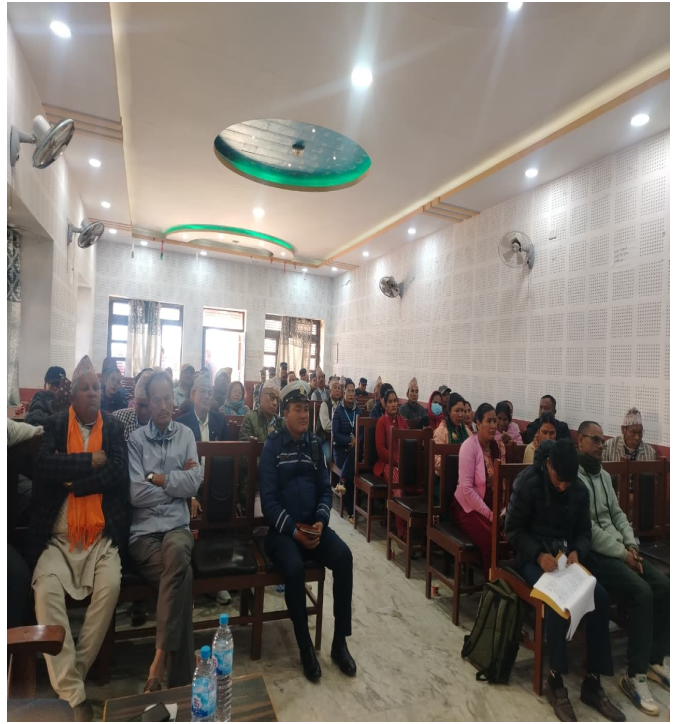
सार्वजनिक सुनुवाई कार्यक्रम