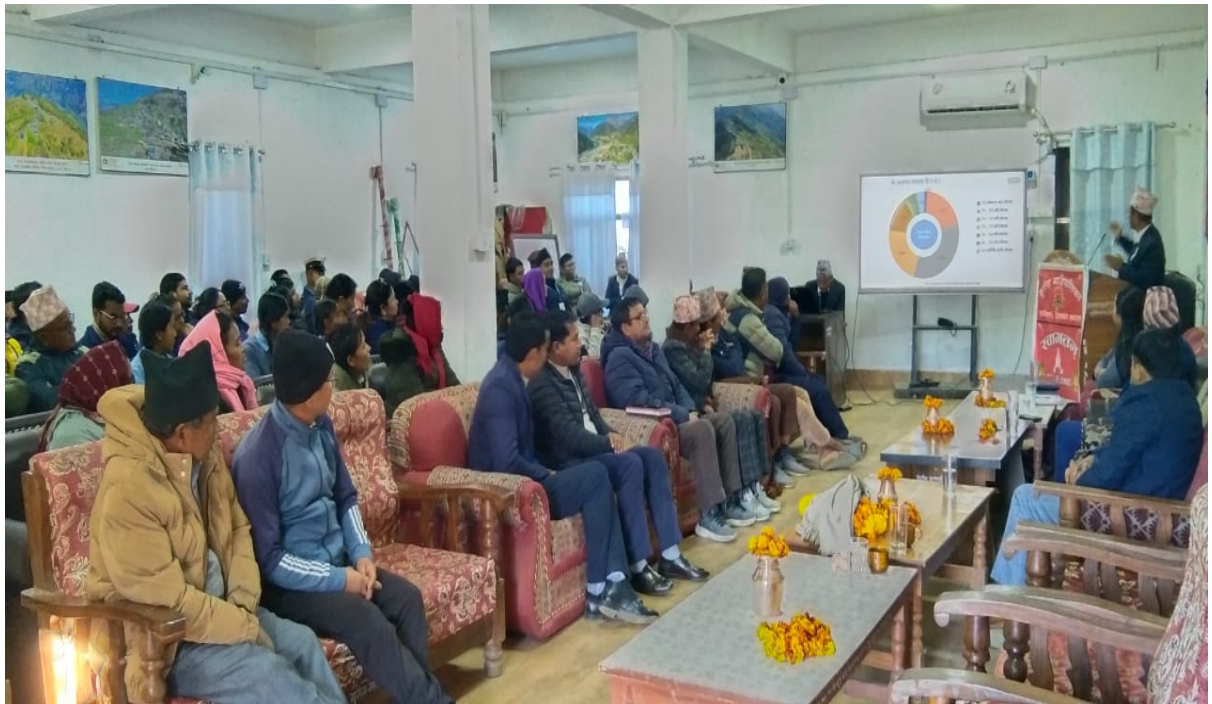
स्थानीय तहमा शान्ति सुरक्षा, अपराध नियन्त्रण तथा सेवा प्रवाह सम्बन्धी सचेतना कार्यक्रम