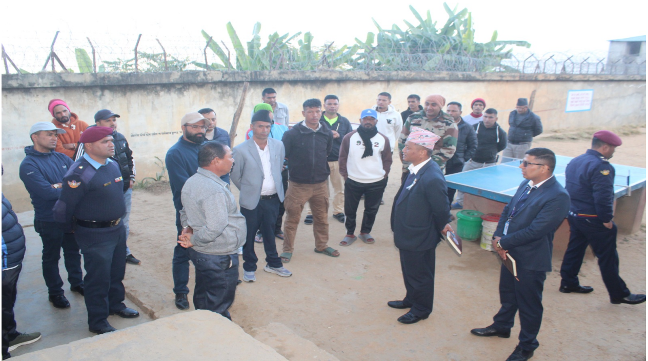
दैलेख जिल्ला कारागार निरीक्षण