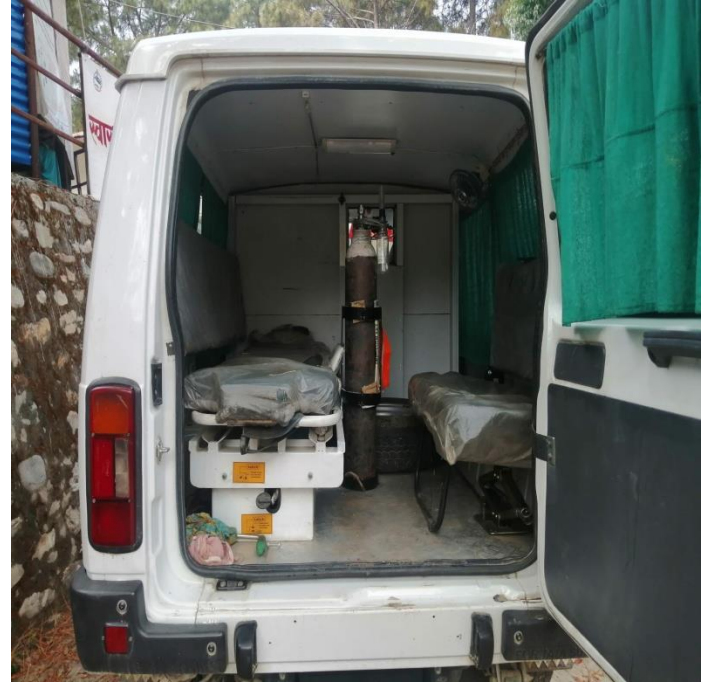
COVID-19 Friendly Ambulance