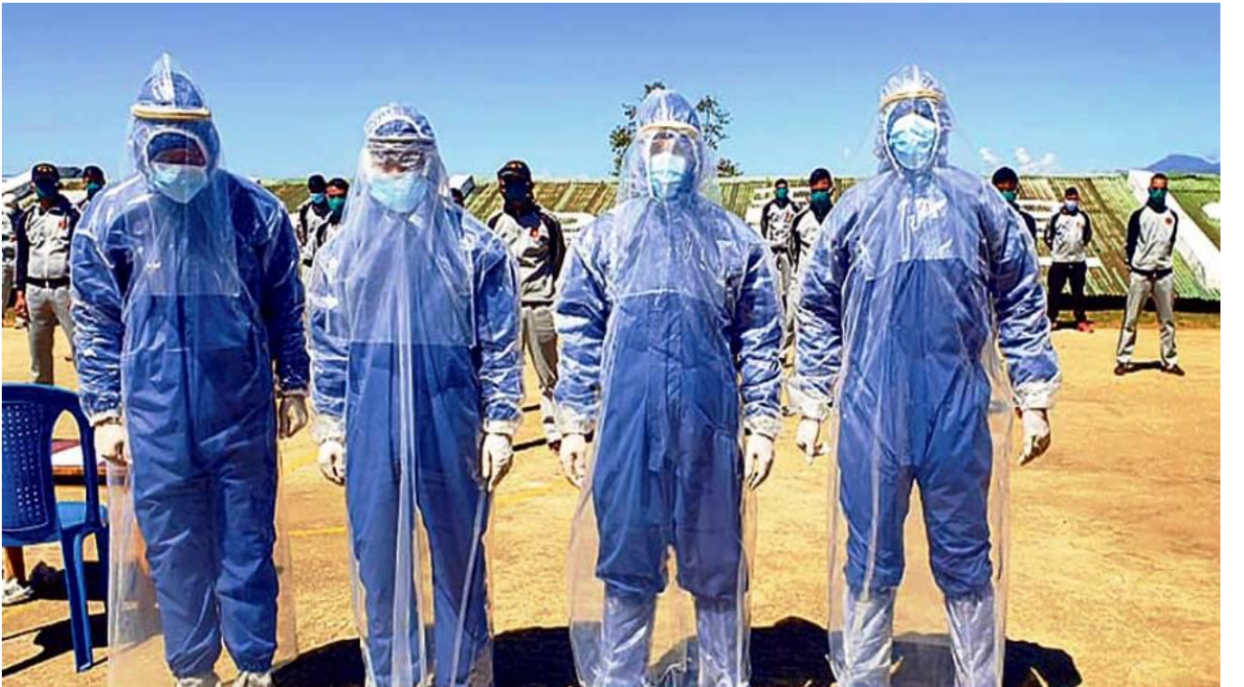
स्वास्थ्यकर्मी व्यक्तिगत सुरक्षा उपकरण(PPE)मा