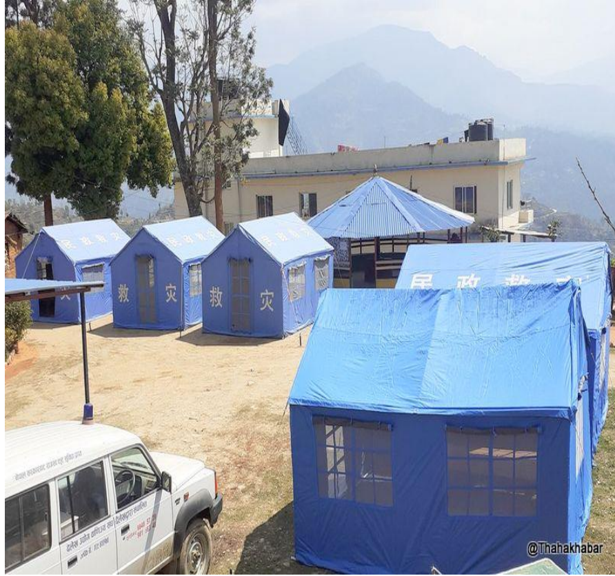
जिल्ला प्रहरी कार्यालय, दैलेखमा स्थापना गरिएका क्वारेन्टाइन

कोरोना भाइरस(COVID-19) बाट सृजित यस विषम परिस्थितिको सामना गर्न स्वास्थ्य, सुरक्षा, खाद्यन्न, क्वारेन्टाइन, आइसोलेशन लगायत जिल्लामा उपलब्ध श्रोतसाधनको प्रयोग गरी सवै संयन्त्रलाई तयारी अवस्थामा राखिएको र जिल्ला प्रशासन कार्यालय, दैलेखबाट जारी आदेशको प्रभावकारी पालना गर्नुभएकोमा संकट व्यवस्थापन केन्द्र, जिल्लास्तरीय संरचना, दैलेखसम्पूर्ण जिल्लाबासीहरूमा हार्दिक धन्यवाद प्रकट गर्दै आगामी दिनहरूमा समेत लकडाउनको पूर्ण पालना गर्दै घरभित्र रहनुहुन हार्दिक अनुरोध गर्दछ।