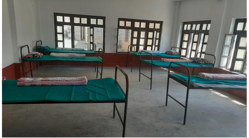
नारायण क्याम्पसमा निर्माण गरिएको क्वारेन्टाइन बेड

दैलेखको नारायण नगरपालिका वडा नं. ७ रामपुर स्थित नारायण क्याम्पसमा ४७ बेडको क्वारेन्टाइन र सरस्वति मा. वि. तर्ताङ्गमा २० बेडको आइसोलेशन निर्माण गरिएको छ। जिल्ला प्रशासन कार्यालय, दैलेख नारायण नगरपालिका, नेपाली सेना, नेपाल प्रहरी, सशस्त्र प्रहरी बल नेपाल र स्वास्थ्य सेवा कार्यालयको संयुक्त प्रयासमा उक्त क्वारेन्टाइन र आइसोलेशन निर्माण कार्य गरिएको हो।