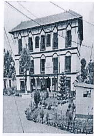
जिल्ला प्रशासन कार्यालय, दैलेखको भवन