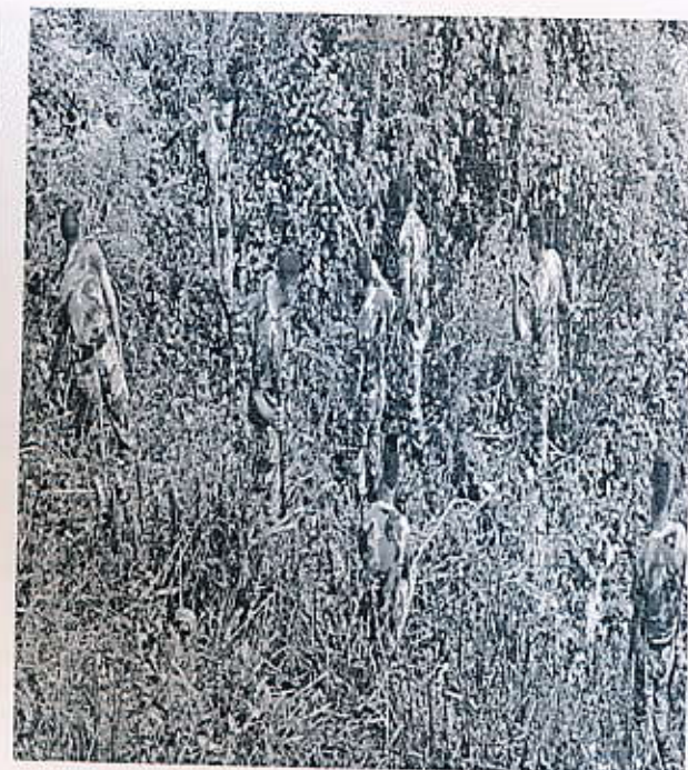
कार्यालय परिसरमा नेपाली सेना र सशस्त्र प्रहरी बलद्वारा सरसफाई गरिदै