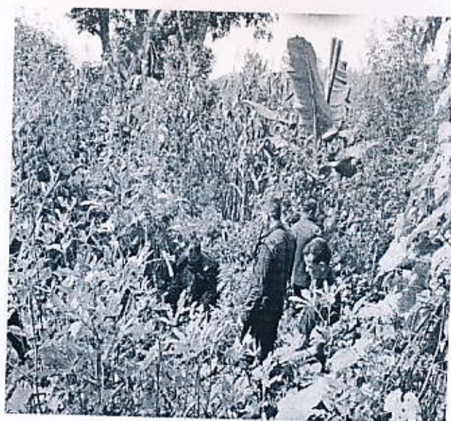
गाजा फडानी गरिदै