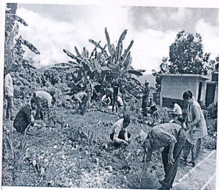
कार्यालय परिसरमा कर्मचारीद्वारा सरसफाई गरिदै