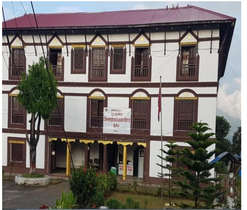
जिल्ला प्रशासन कार्यालय, दैलेखको भवन

नेपालको संविधान, २०१९ बमोजिम नेपाल अधिराज्यलाई १४ अञ्चल ७५ जिल्ला र ५ विकास क्षेत्रमा विभाजन गरियो। स्थानीय प्रशासन विकेन्द्रीत प्रशासन व्यवस्था अनुरूप संचालन गर्न तथा शान्ति सुरक्षा व्यवस्थापनलाई प्रभावकारी रूपमा संचालन गर्न स्थानीय प्रशासन ऐन, २०२८ जारी गरी लागू गरियो। उक्त ऐनको दफा ५ ले जिल्लाको सामान्य प्रशासन संचालन गर्न प्रत्येक जिल्लामा एउटा जिल्ला प्रशासन कार्यालय रहने व्यवस्था बमोजिम यस जिल्ला प्रशासन कार्यालय, दैलेखको स्थापना भएको हो। नेपालको मौजुदा संविधान अनुसार नेपालमा ७ वटा प्रदेश, ७७ जिल्ला कायम भएका छन्। नेपालका ७७ वटा जिल्ला मध्ये यस जिल्ला प्रशासन कार्यालय, दैलेखको कार्यालय नारायण नगरपालिका-१, दैलेखको गौडा दरवारमा रहेको छ।